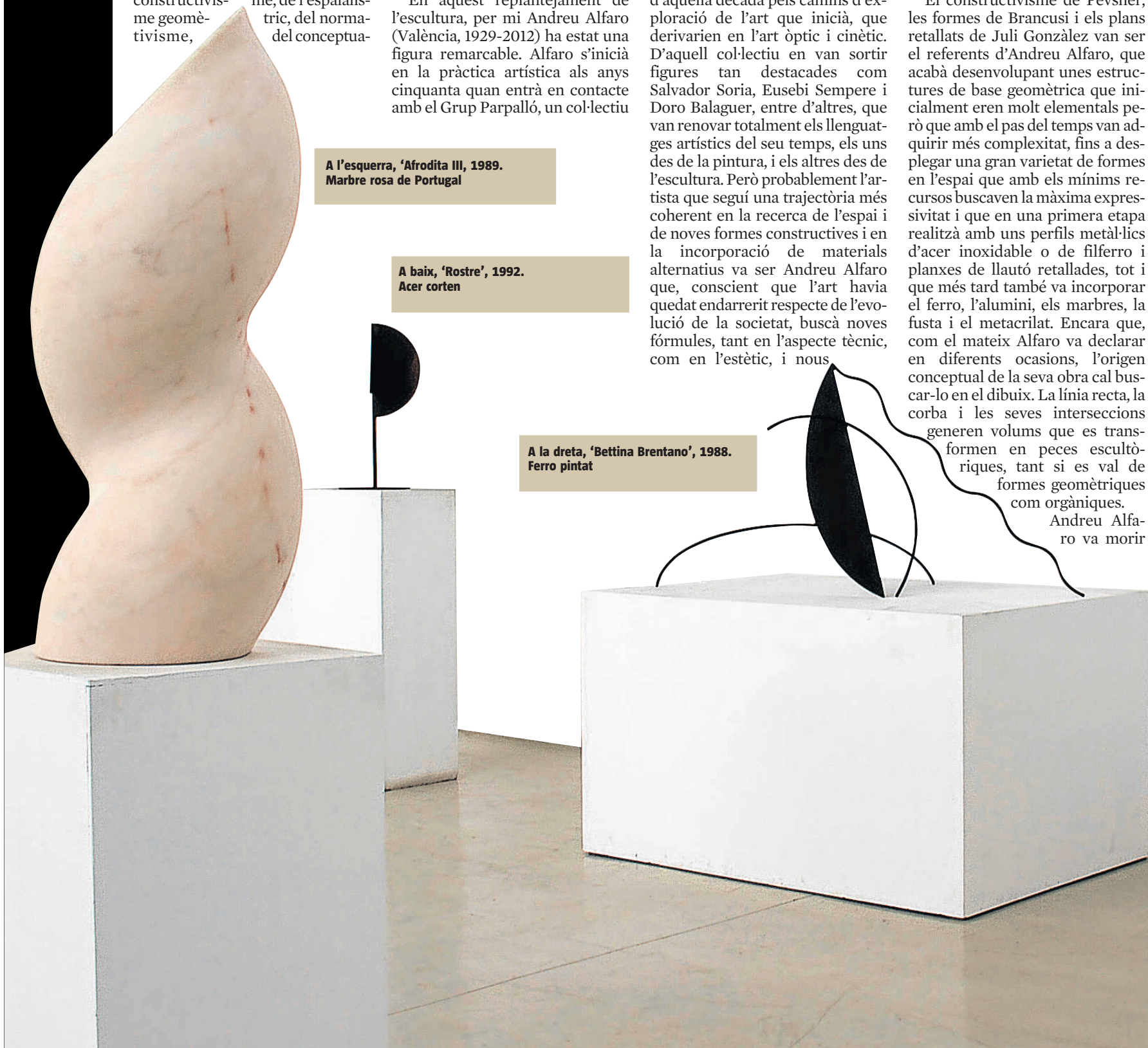
A la dreta, 'Bettina Brentano', 1988. Ferro pintat